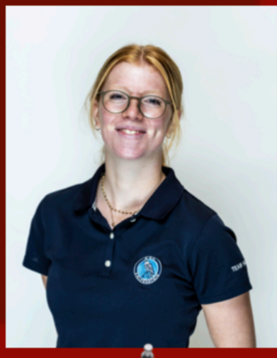
Florentine „Flipsi“ Hoyer

Ich bin Sirah Steinhoff, 22 Jahre alt und spiele in der 1. Bundesliga für den Hamburger GC - Falkenstein. Neben dem Studium gehe ich gerne ins Fitnessstudio und leite das Kleine Falken Training im HGC.